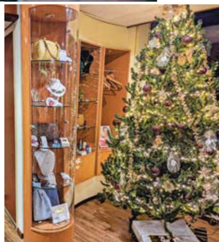
Weihnachten an Bord