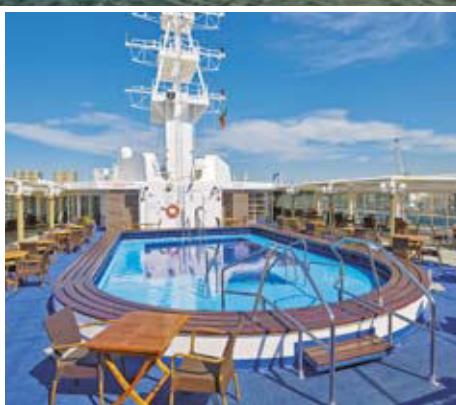
Sonnendeck mit Außenpool