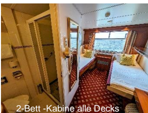
2-Bett -Kabine alle Decks