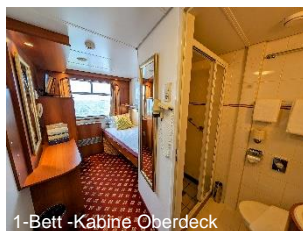
1-Bett -Kabine Oberdeck