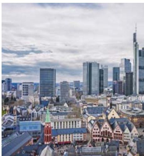
Frankfurt am Main, Skyline