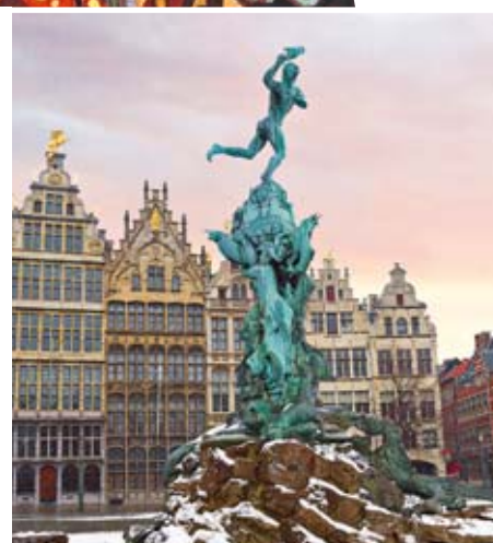
Winter in Antwerpen