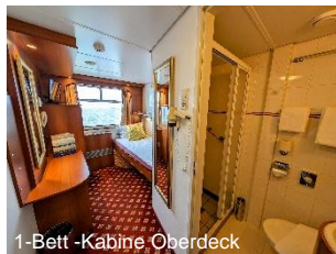
1-Bett -Kabine Oberdeck